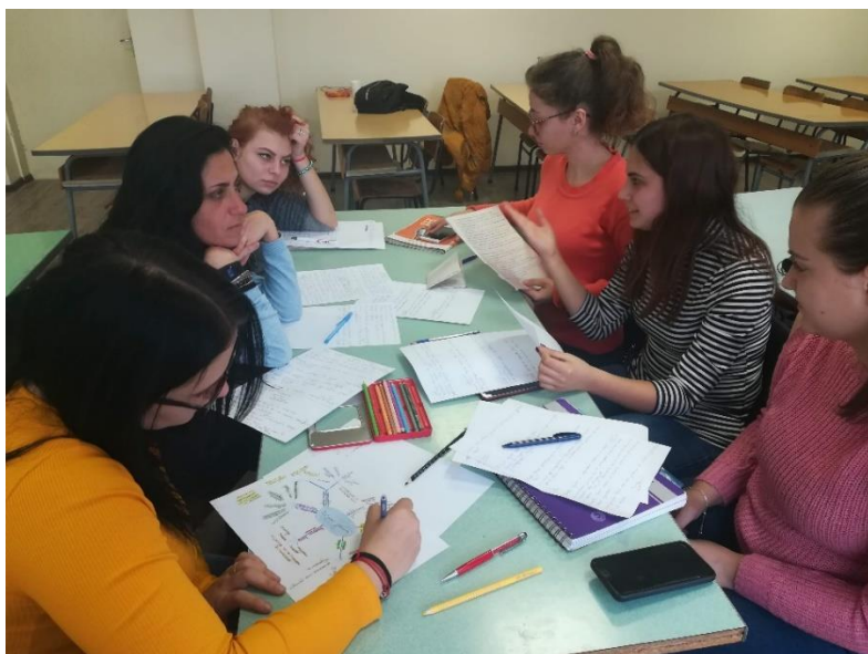
Фигура 2. Работа в група и създаване на мисловна карта по темата „Достатъчно добрият учител“

На студентите се представя методът Mind-map или „Мисловна карта“, който е създаден от Тони Бюзан през 60-те години на ХХ-ти век [1]. Мисловните карти, известни още като карти на знанието, са начин за визуализиране на комплексни идеи чрез диаграми, текстове и изображения. Те са добро помощно средство в процесите на обучение и когато се налага организиране на разнородна информация при търсене на решения.