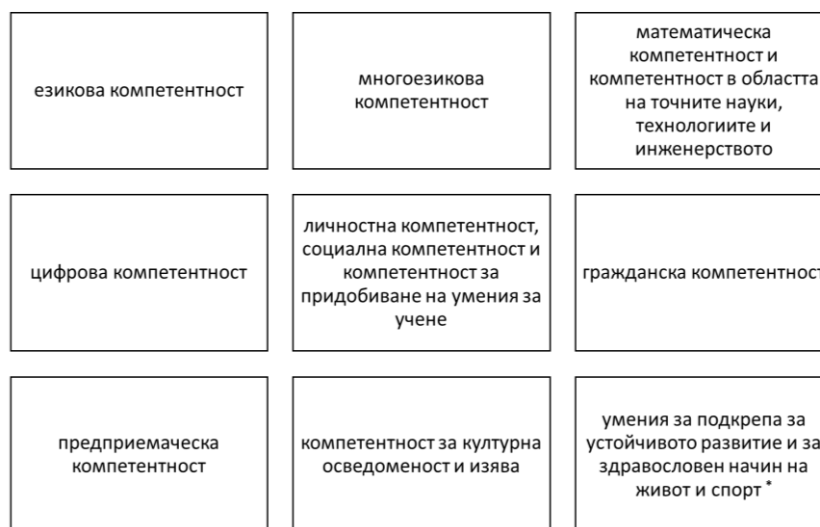
Фигура 1. Рамка на ключовите компетентности за учене през целия живот, приети по препоръка на Съвета на Европейския съюз и Европейския парламент (2006 г.) 1

Формирането на подобни компетентности във висшето образование изисква обучението да осигурява реален практически контекст, който не винаги е достъпен. Използването на миналия личен опит на студентите в процеса на обучение е ценен ресурс при формирането на педагогическите им компетенции. Настоящата статия представя възможностите за използването на личния опит и приложение на техниката „ Мисловна карта “ в обучението на студенти от педагогически специалности по дисциплината „ Педагогическа психология “.